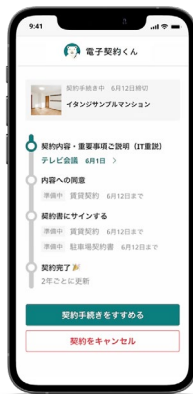
「電子契約くん」入居者利用画面イメージ