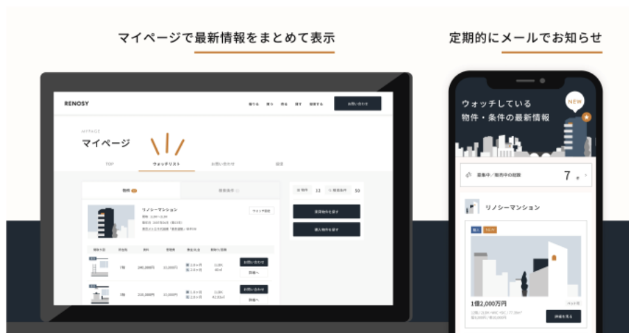
左：ウォッチリスト利用画面イメージ、右：メールイメージ