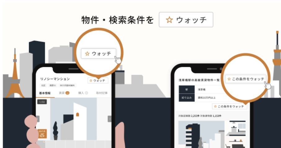
左：物件をウォッチするためのボタン、右：検索条件をウォッチするためのボタン

また、ウォッチリストに追加した物件や検索条件に合致する物件の最新情報をメールで定期的にお知らせすることにより、空室・販売情報の見逃しや、入居・購入機会の損失を防ぎます。