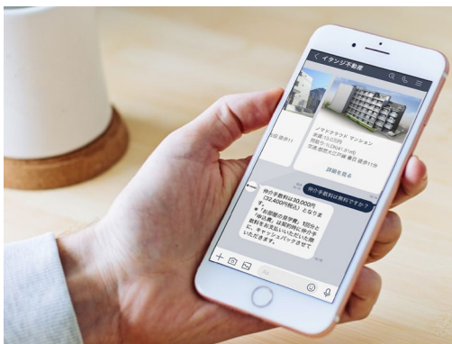
「ノマドクラウド」入居者利用イメージ

物件確認電話の自動応答システム「ぶっかくん」 賃貸住宅の内見予約WEB受付システム「内見予約くん」 不動産関連WEB申込受付システム「申込受付くん」 不動産関連電子契約システム「電子契約くん」 賃貸住宅のWEB更新・退去システム「更新退去くん」 不動産関連業務の自動化システム「RPAくん」 顧客管理・自動物件提案システム「ノマドクラウド」等