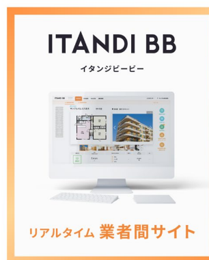
「ITANDI BB +」サービス展開イメージ