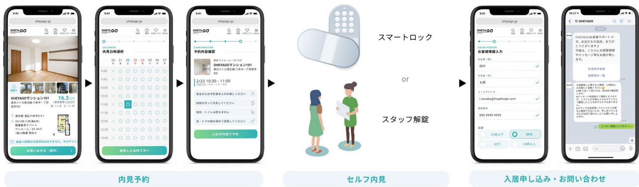
OHEYAGOでのセルフ内見イメージ

非対面サービスが増加する中、イタンジは「OHEYAGO」を通じ、不動産業界のDX推進に貢献し、入居希望者にとって新たなお部屋探しの体験ができる安心で利便性の高いサービスを提供してまいります。