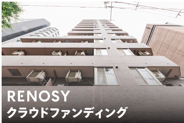
<「RENOSY クラウドファンディング キャピタル重視型 第22号ファンド」>