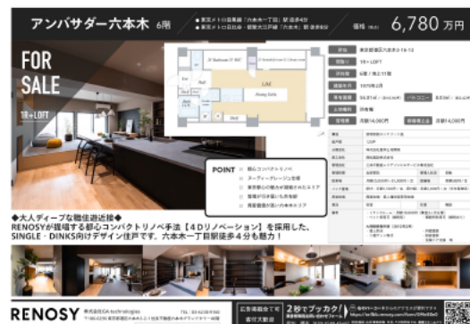
<QR付きマイソク 参考例>