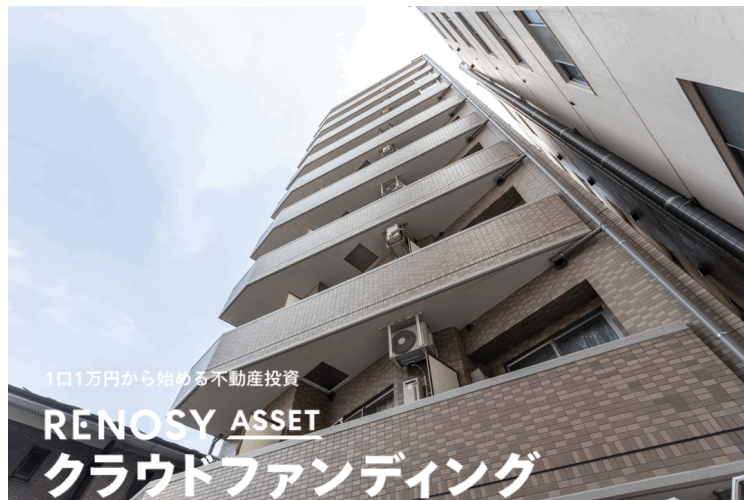
<「RENOSY ASSET（リノシー アセット）クラウドファンディング キャピタル重視型 第17号ファンド」>