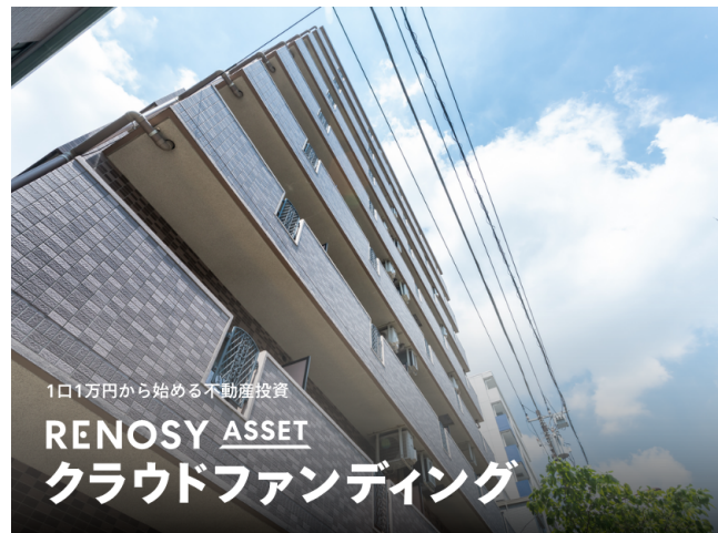
<「RENOSY ASSET（リノシーアセット）クラウドファンディング」 キャピタル重視型（※1）第11号ファンド>

サービスサイト（※2019年7月24日リニューアル）： https://www.renosy.com/funding