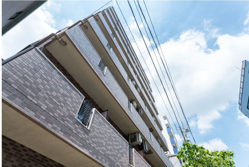
< 「RENOSY ASSET（リノシーアセット）クラウドファンディング」 第11号ファンド（キャピタル重視型（※1）） >