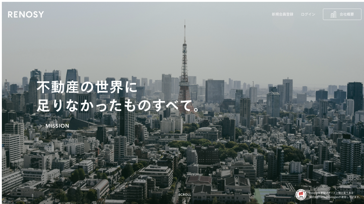
<新しくなった、「RENOSY（リノシー）」のサービスサイトトップ>