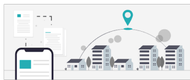
「賃貸に住みたい」と思ったら OHEYA GO (オヘヤゴー) にアクセス!

入居希望者は、従来のように、不動産仲介会社へ希望条件を伝えたり、営業マンと内見時間の調整を行ったり、鍵の受け渡しなどのタイムロスをしたりすることなしで、スマートフォンからワンクリックで内見予約ができるため、早朝やランチタイム、夜などの隙間時間を活用し、自身のペースですぐに希望物件の内見ができます。また、内見して気に入れば、その場でスマートフォンから入居申し込みをすることができ、保証会社の審査へも連携できるため、複数書類を記入・送付する必要がありません。その後の賃貸借契約をIT重説(※1)を進めることにより、不動産会社へ一度も来店することなく(※2)、賃貸物件を借りることが可能です。さらに、仲介手数料は一般的な価格(※4)よりも安価になります。