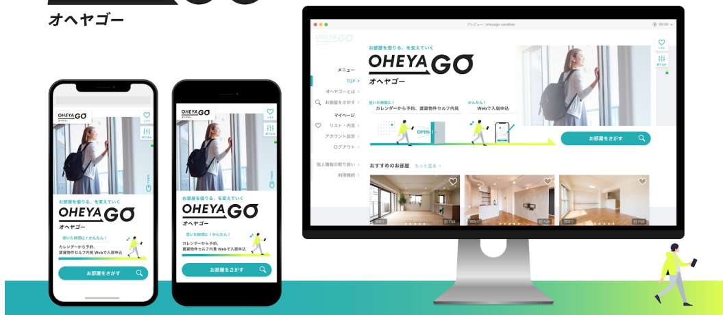
<OHEYA GO（オヘヤゴ）サイト イメージ> 画面は開発中のものです。仕様は予告なく変更される場合があります。